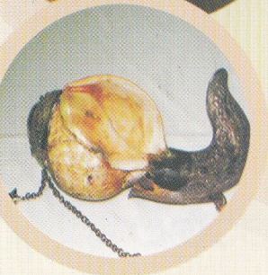
මැණික් හා රිදී කැටයම් සහිත මෙම හක්ගෙඩිය ඉතා පැරණිය