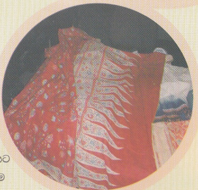
නුවර යුගයෙහි මුල් කාලයට අයත් මෙම ඉපැරණි රෙදිපිළි “සෝමන” නැමති භාණ්ඩයට අයත්ය