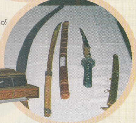
ඉපැරණි පුස්තක පොත් පැරණි අසිපත් කිහිපයක්