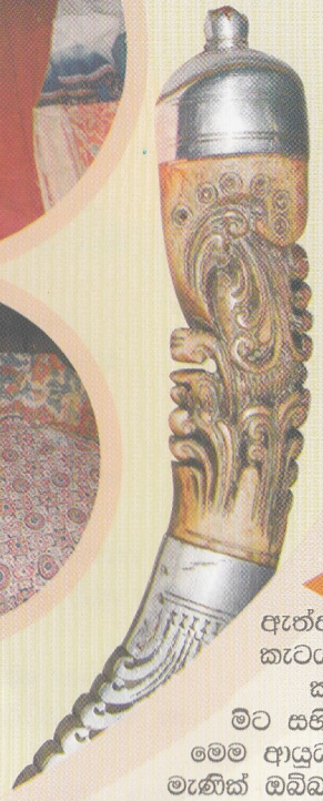
ඇත්දළ කැටයම් කළ මිට සහිත මෙම ආයුධය මැණික් ඔබ්බවා අලංකාර කර ඇති කෞතුක භාණ්ඩයකි

අද විවිධ රටවල, විශේෂයෙන්ම ආර්ථික අතින් පොහොසත් රටවල ඇතිවී තිබෙන වෙළඳපොල මෙම භාණ්ඩ මෙරටින් පිටකිරීමේ අධික ඉල්ලුමට හේතුවී තිබේ. එම නිසා මල කළ නොහැකි අපේ සංස්කෘතික දායාදයන් මෙරටට අහිමිවීමේ තර්ජනයක් ඇතිවී තිබේ.