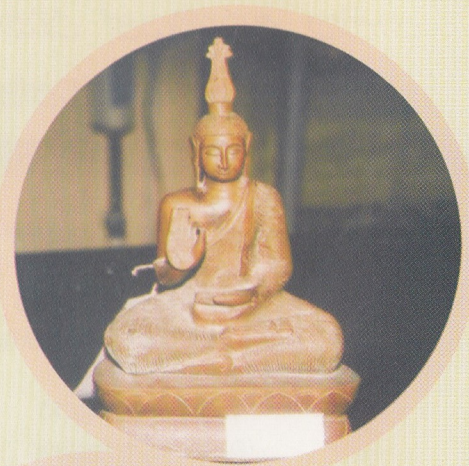
කෞතුක වටිනාකමකින් යුතු ලෝකඩ මුදු පිළිමයක්